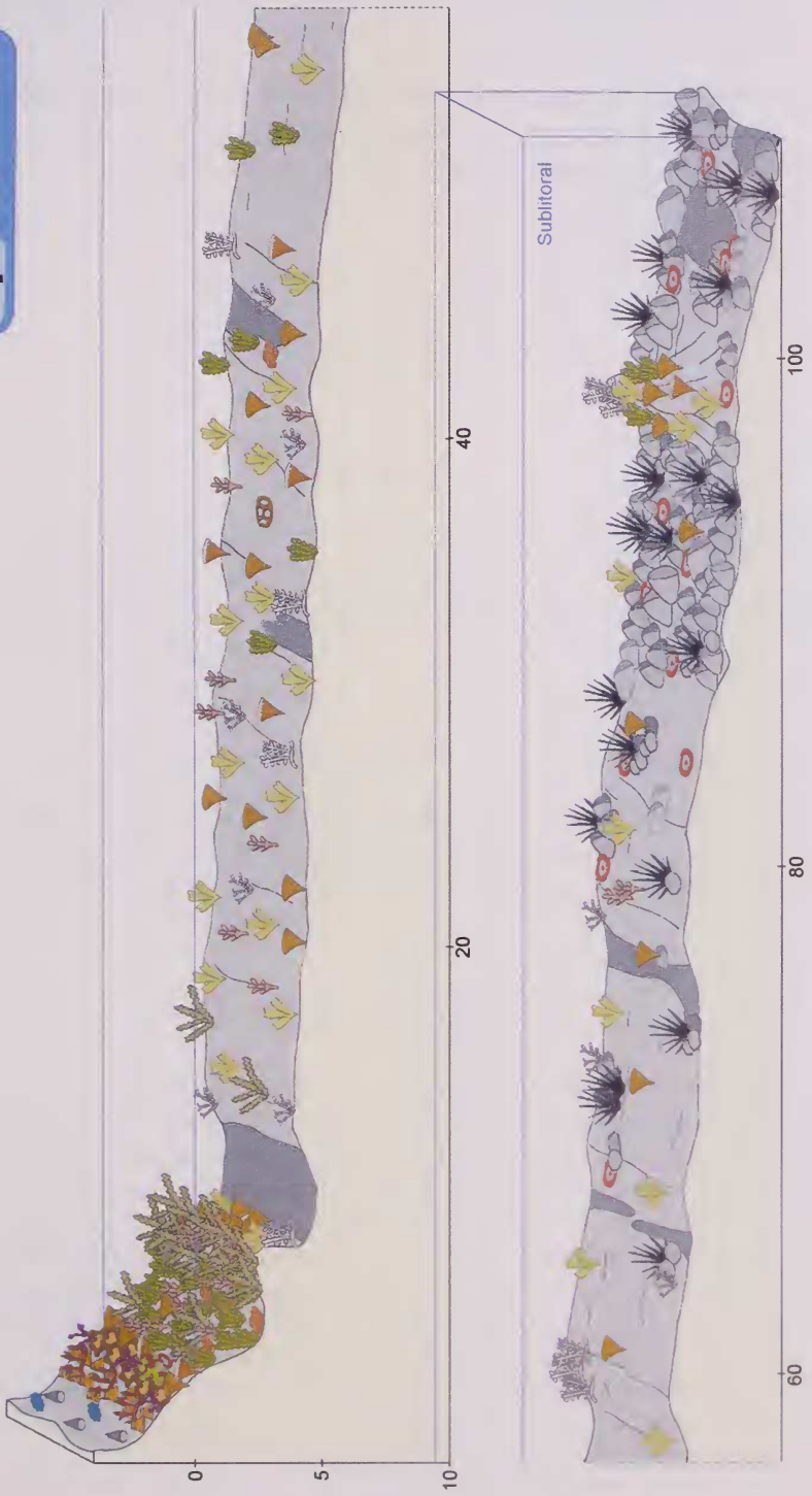
Fig. 6. Punta de Fuencaliente. Esquema del perfil del litoral con la zonación de las especies dominantes.